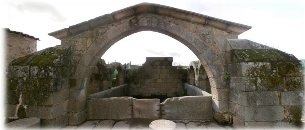
Fuente la Conceja

Olvidada durante muchos años, en 1987 la Junta de Extremadura ratificó la fuente como Bien de Interés Cultural, llevándose a cabo su restauración en 1996.