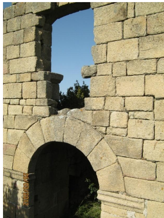
Castillo de Peñafiel

Según algunas leyendas, el nombre tendría su origen en la historia de Rachel, la amante del señor del castillo, que acaba enamorándose de un caballero cristiano. Racha significa 'piedra' o 'roca', y hace referencia a la situación de la fortaleza, en lo alto de un promontorio granítico. Racha-Rachel se traduciría como 'La roca de Rachel'.