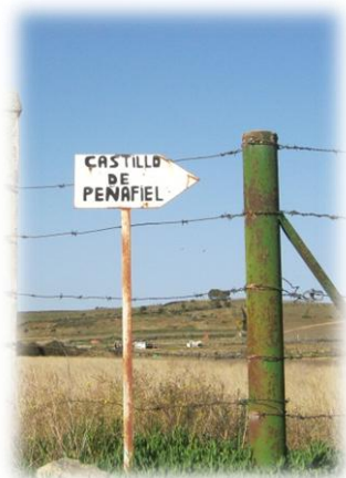
Señalización Ruta Castillo de Peñafiel

SUGERENCIAS: Durante la ruta nos vamos a encontrar señalización, aunque escasa, de la ruta del Castillo de Peñafiel como se muestra en la siguiente imagen.