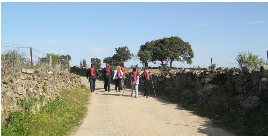
Camino donde podemos observar las huertas de los vecinos

Una vez iniciamos nuestro camino podemos observar las huertas de los vecinos de Zarza la Mayor.