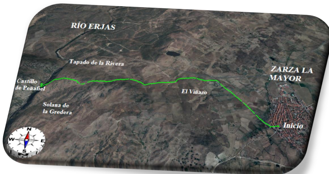
Mapa ruta Castillo de Peñafiel-Zarza la Mayor