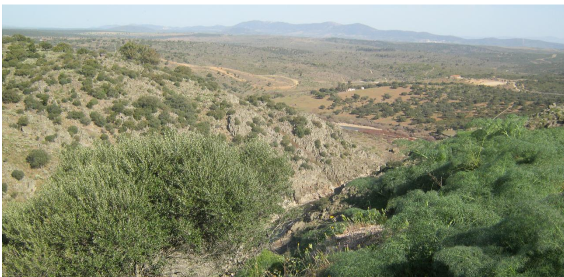
Panorámica de la cuenca del Érjas y Portugal

Para llegar a nuestro punto de partida volvemos por nuestros mismos pasos, hasta Zarza la Mayor.