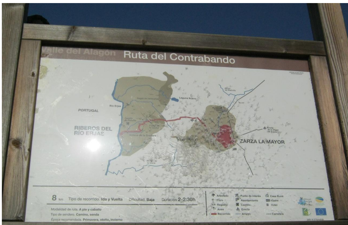
Panel indicativo del comienzo de la ruta

A unos metros del callejón donde se encuentra la fuente, podemos observar una señal de dirección que nos indica la dirección de la Ruta del Contrabando, que se solapa en parte con la del Castillo de Peñafiel. Desde este callejón empezamos nuestra ruta dirección Noroeste.