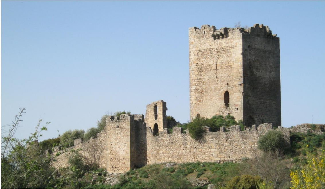
Vistas del Castillo de Peñafiel

El Castillo de Peñafiel , fortaleza fue construida en el siglo IX por los bereberes. Se piensa que en un primer momento sólo fue una torre de vigilancia que se utilizaba para proteger el territorio de los reinos cristianos del norte.