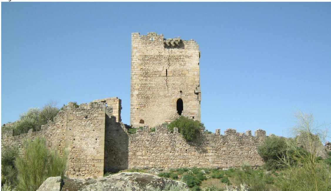
Castillo de Peñafiel

El castillo contaba con al menos dos perímetros defensivos. Precisamente la barbacana constituye una de las partes mejor conservadas. Está situado a 3 km de Zarza la Mayor , justo en la frontera con Portugal que marca el río Erjas. La zona en la que se encuentra el Castillo de Peñafiel (Racha-Rachel) es de gran riqueza paisajística y forma parte del Parque Natural del Tajo Internacional.