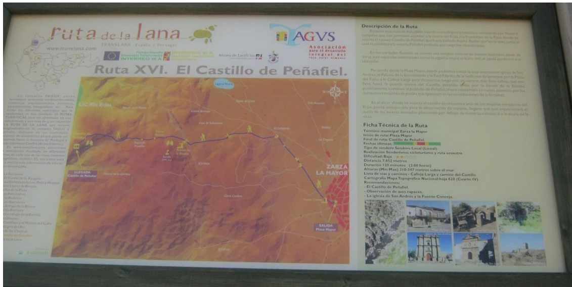
Panel indicativo Castillo de Peñafiel

la izquierda, donde encontraremos un panel informativo que nos explica el Castillo de Peñafiel y la ruta que nos lleva hasta el mismo.