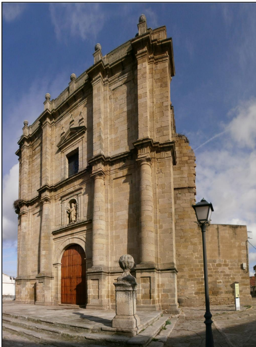
Iglesia de San Andrés

La Iglesia de San Andrés está declarada Bien de Interés Histórico Artístico. La fachada principal es de estilo Herreriano, bóveda de crucería y presbiterio octavado. Edificada de 1668 a 1681 sobre los cimientos de la primitiva iglesia, destruida en 1665 a consecuencia de una explosión durante la Guerra de la Independencia con Portugal. Se conservan esculturas del siglo XVIII, así como un Cristo Yacente articulado y policromado.