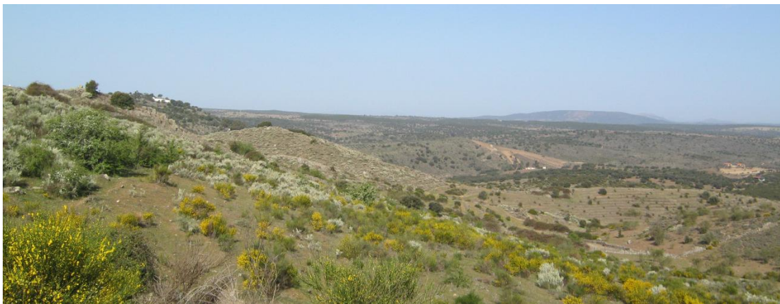
Panorámica del entorno de la ruta

A continuación, avanzaremos por el camino, pero a pocos metros de él veremos como éste se torna más enrevesado y casi sin delimitar, ya que entramos en fincas con ganado y diversas porteras, por lo que en ocasiones tenemos que imaginarnos la dirección de la ruta.